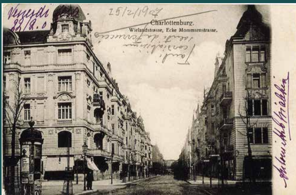
Cartolina illustrata di Charlottenburg