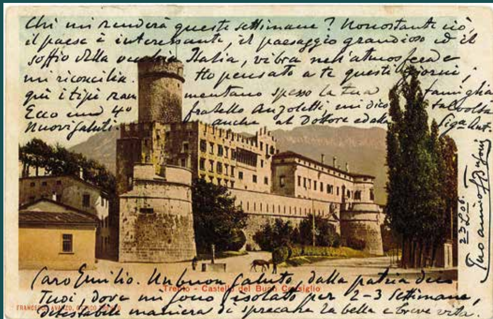
Cartolina illustrata di Trento