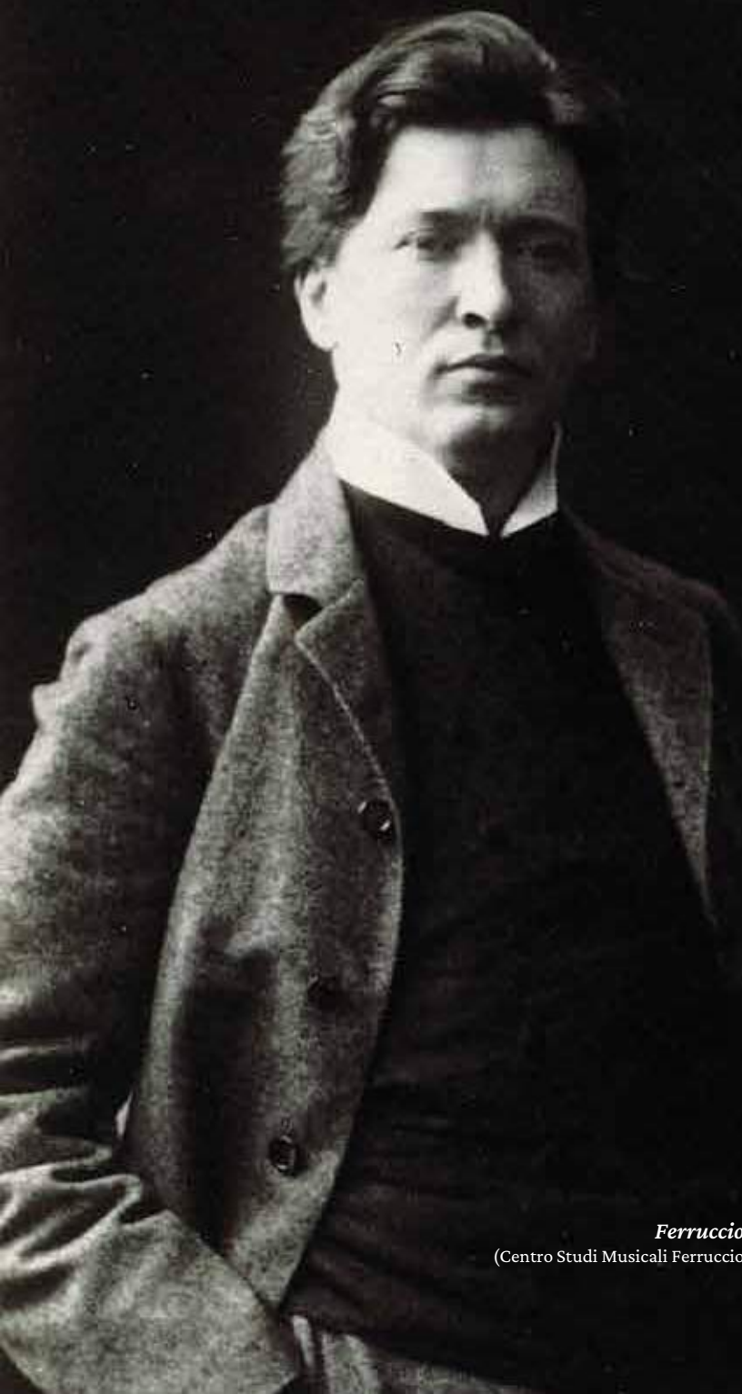
Ferruccio Busoni (part.), 1904