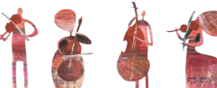
Illustrazioni di Elisabetta Reicher